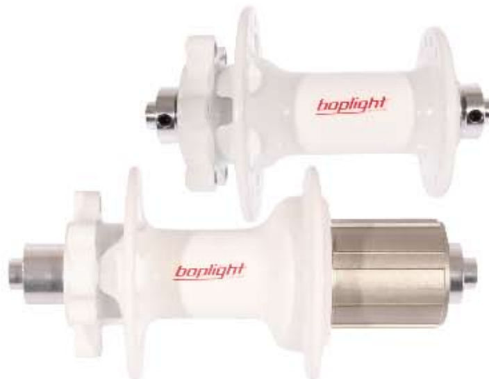
02 Piasta Bopligh Super Race F Materiał: aluminium 7075, oś M9 - 100x108, 32 otwory, 2 łożyska maszynowe, dostępne kolory: czerwony, niebieski i biały, waga: 152g Piasta Bopligh Super Race R Materiał: aluminium 7075, oś M10 - 135x145, 32 otwory, 4 łożyska maszynowe, dostępne kolory: czerwony, niebieski i biały, waga: 280g