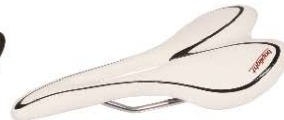
04 Siodło Bopligh Team ergonomic White Sportowe siodło do użytku szosowego i MTB, komfortowy kształt z ergonomicznym otworem, kolor biały, waga 225g