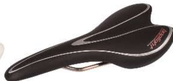
03 Siodło Bopligh Team Sportowe siodło do użytku szosowego i MTB, waga: 201g