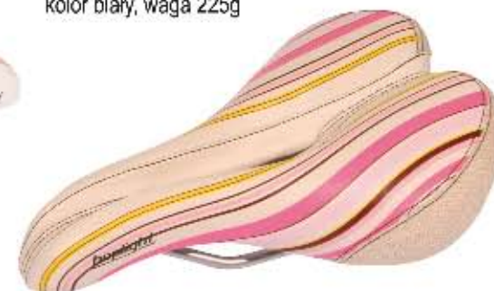
08 Siodło Bopligh Lady komfort Wygodne siodło damskie, komfortowy kształt z ergonomicznym otworem