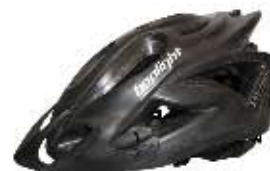
09 Kask Bopligh 90 Rozmiary: 54-58/58-62 Ilość otworów: 18 Technologia: Double In Mold, zapięcie Easy Fix, 3 wersje kolorystyczne: niebieski, srebrny mat, czarny. W komplecie daszek oraz zaślepki otworów. Waga: 280g