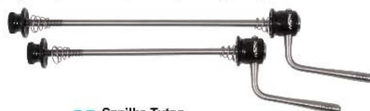
06 Szpilka Tytan Do użytku szosowego i MTB, waga kompletu: 68g