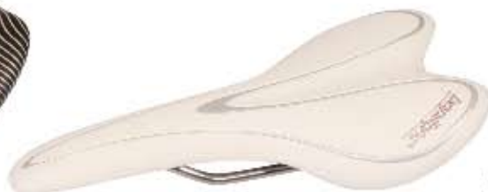
02 Siodło Bopligh Team White Sportowe siodło do użytku szosowego i MTB, kolor biały waga: 204g