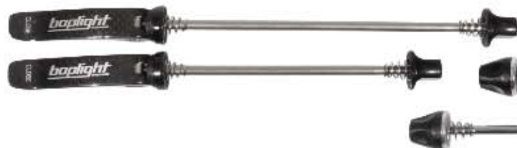
07 Szpilka Carbon, Do użytku szosowego i MTB, waga kompletu: 78g