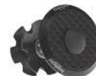
10 Korek Bopligh Carbon Karbonowy korek do sterów, waga: 26g