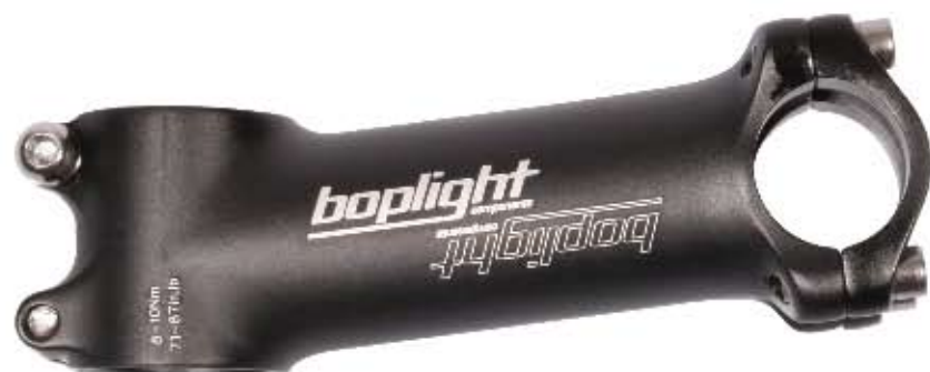
03 Mostek Bopligh Team Materiał: aluminium 7075 T6 3D, długości: 90/100/110/120/130 mm, średnica mocowania kierownicy 25,4mm, kąt 8°, obustronny, waga: 109g