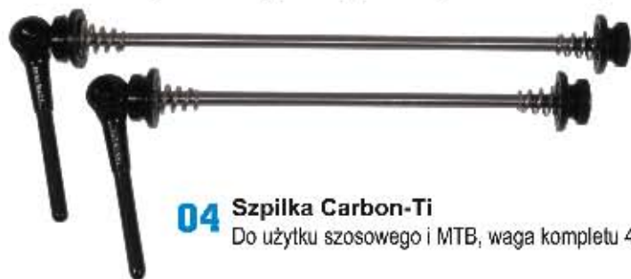
04 Szpilka Carbon-Ti Do użytku szosowego i MTB, waga kompletu 42g