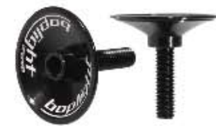
11 Korek Bopligh Aluminiowy korek do sterów z zintegrowaną śrubą, waga 5g