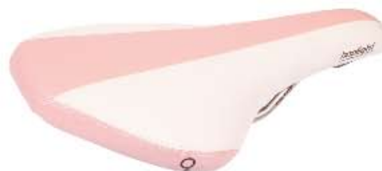
07 Siodło Bopligh Lady Komfortowe siodło damskie