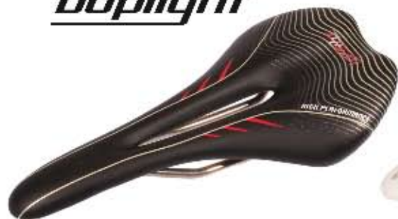
01 Siodło Bopligh Race Sportowe siodło do użytku szosowego i MTB, komfortowy kształt z ergonomicznym otworem, waga 215g