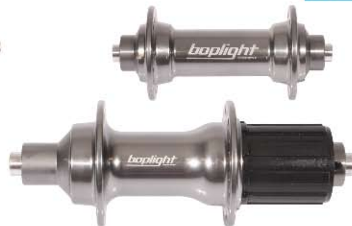
03 Piasta Bopligh Team F Materiał: aluminium 7075, oś 100x108, 32 i 36 otwory, 2 łożyska maszynowe, waga: 132g Piasta Bopligh Team R Materiał: aluminium 7075, oś 135x145, 32 i 36 otwory, 4 łożyska maszynowe, waga: 368g