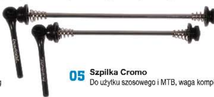
05 Szpilka Cromo Do użytku szosowego i MTB, waga kompletu 45g