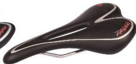
06 Siodło Bopligh Lady sport Sportowe siodło, zaprojektowane specjalnie dla kobiet, kształt ergonomiczny, do użytku szosowego i MTB, waga: 260g