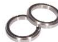
09 Łożyska Łożyska maszynowe kompatybilne ze sterami VP Bopligh.