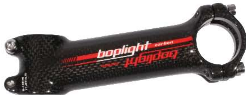
05 Mostek Bopligh Carbon Materiał: carbon/aluminium, długości: 100/120mm, średnica mocowania kierownicy 31,8mm, kąt 8°, obustronny, waga: 139g