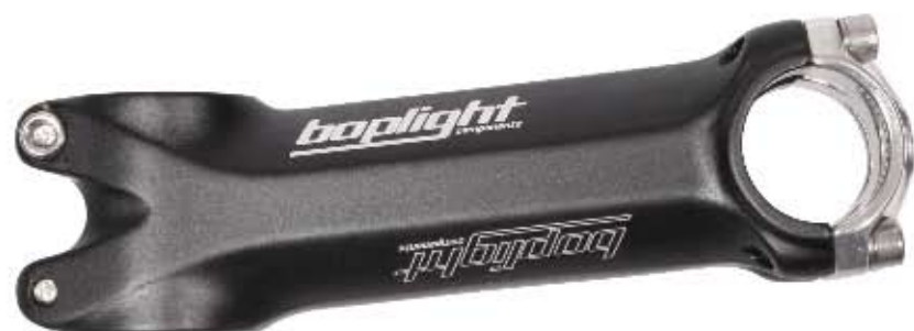
01 Mostek Bopligh Race Materiał: aluminium 7001A T6 3D, długości: 90/100/110/120/130 mm, średnica mocowania kierownicy 25,4 i 31,8mm, kąt 6°, obustronny, waga: 105g (ze śrubami tytanowymi)