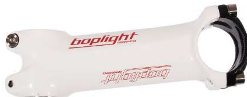
02 Mostek Bopligh Race Biały Materiał: aluminium 7001A T6 3D, długości: 100/120mm, średnica mocowania kierownicy 25,4 i 31,8mm, kąt 6°, obustronny, waga: 110g