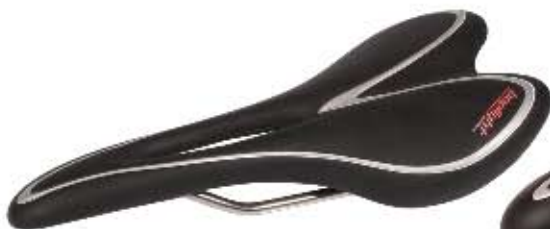
05 Siodło Bopligh Team ergonomic Sportowe siodło do użytku szosowego i MTB, komfortowy kształt z ergonomicznym otworem, waga 225g