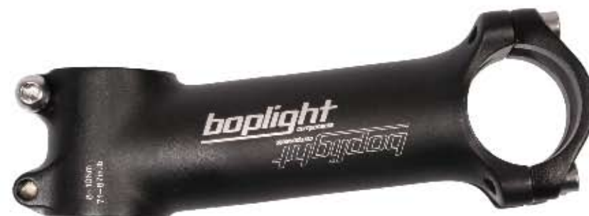
04 Mostek Bopligh Team XL Materiał aluminium 7075 T6 3D, długości: 90/100/110/120/130 mm, średnica mocowania kierownicy 31,8mm, kąt 8°, obustronny, waga: 108g