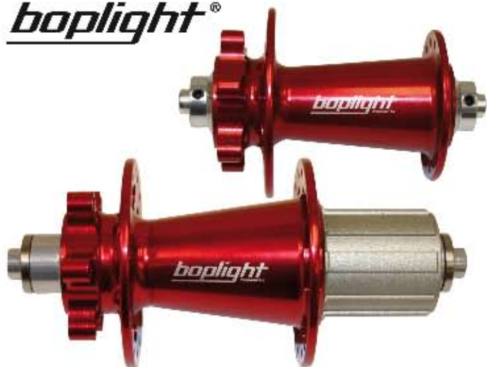
01 Piasta Bopligh Sport F Materiał: aluminium 7075, oś M9 - 10x108, 32 otwory, 2 łożyska maszynowe, dostępne kolory: czerwony, niebieski i czarny, Waga: 152g Piasta Bopligh Sport R Materiał: aluminium 7075, oś M10 - 135x145, 32 otwory, 4 łożyska maszynowe, dostępne kolory: czerwony, niebieski i czarny, Waga: 306g