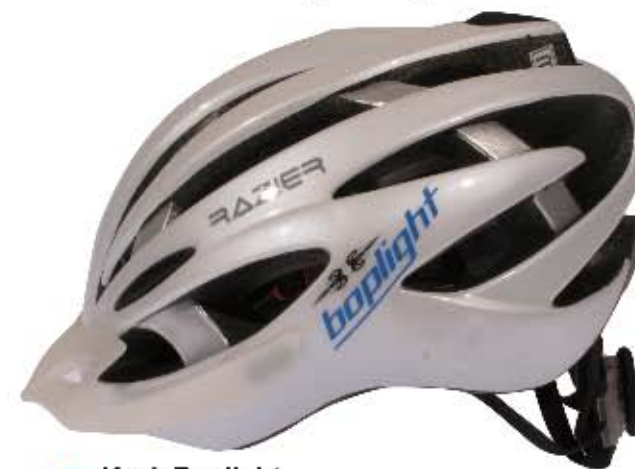
10 Kask Bopligh Rozmiary: S-M 54-58, L-XL 58-62, tum fit, potrójny in mold, 29 otworów wentylacyjnych. Waga: 270g