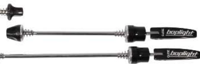
08 Szpilka Aluminium Do użytku szosowego i MTB, waga kompletu: 120g